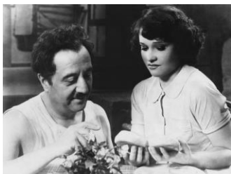
Aurélie : Ginette Leclerc