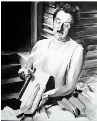
Raimu : l'Aimable boulanger