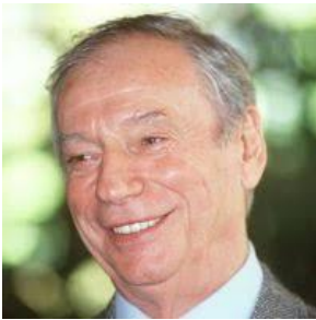
César Soubeyran : Yves Montand